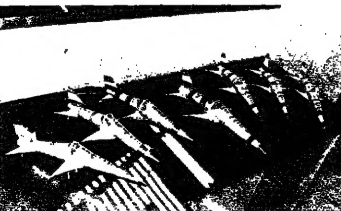
مد طائرات تحمل اسم الأسد وصاروخ فيصل